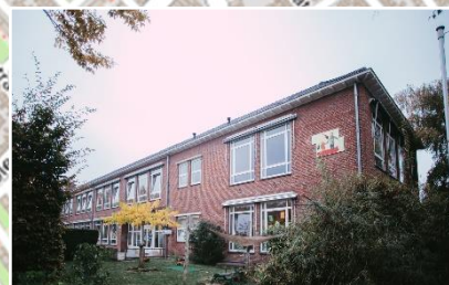
De Zonnebloem | Berberisstraat 4