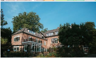
De Beuken | Kerkstraat 5