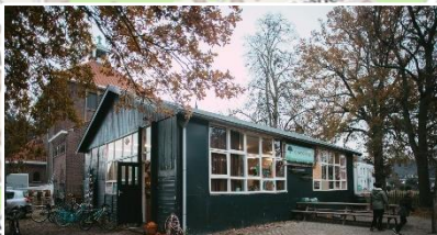
Het Bos | Bredestraat 174